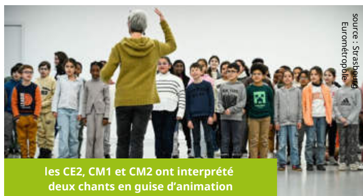
les CE2, CM1 et CM2 ont interprété deux chants en guise d'animation