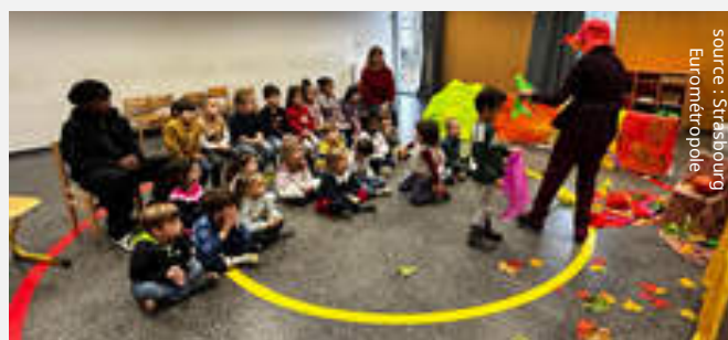
un jeune public attentif et investi