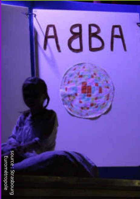
Le livre créé pour la scénographie du spectacle