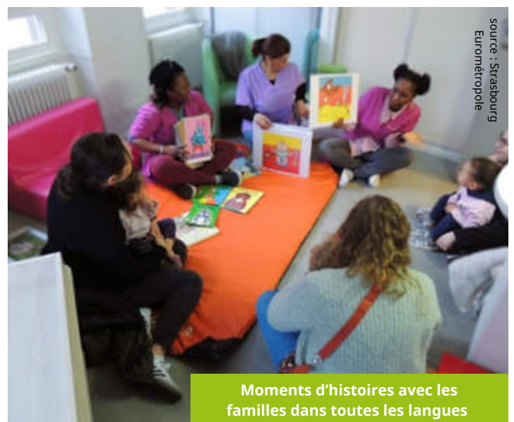
Moments d'histoires avec les familles dans toutes les langues