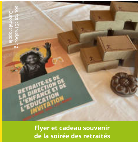
Flyer et cadeau souvenir de la soirée des retraités

■ Melody LAHAYE, assistante département RH