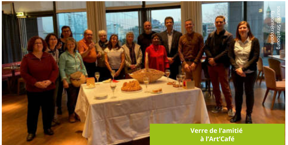
Verre de l'amitié à l'Art'Café