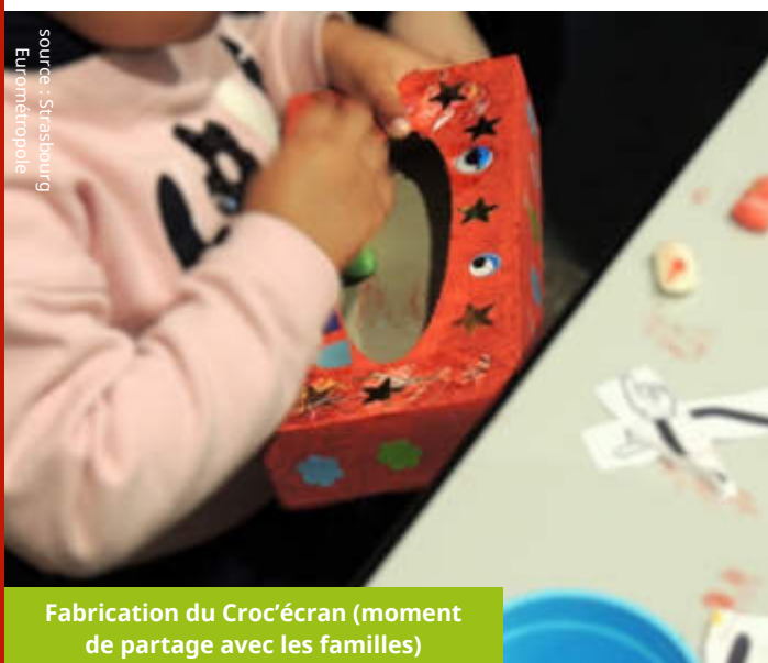
Fabrication du Croc'écran (moment de partage avec les familles)